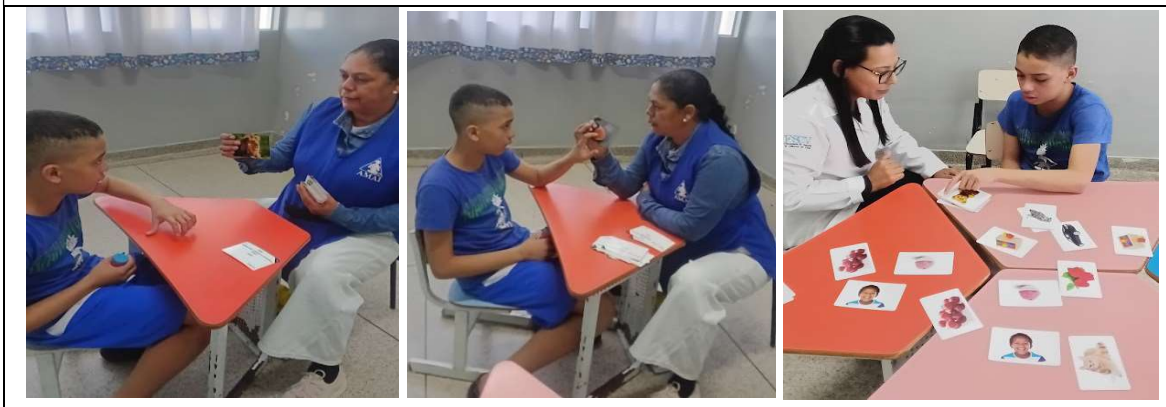
Atividades para comunicação alternativa / aumentativa

No mês de outubro, em parceria com a Prefeitura de Itu, por meio da Secretaria Municipal de Saúde e do Núcleo Municipal de Apoio ao Autista, foi possível realizar a avaliação fonoaudiológica de todos os assistidos, bem como o atendimento daqueles que necessitavam de intervenções específicas. Os atendimentos foram realizados por fonoaudióloga cedida para atuação na AMAI, garantindo a continuidade e a qualificação do acompanhamento terapêutico na área de Comunicação e Linguagem.