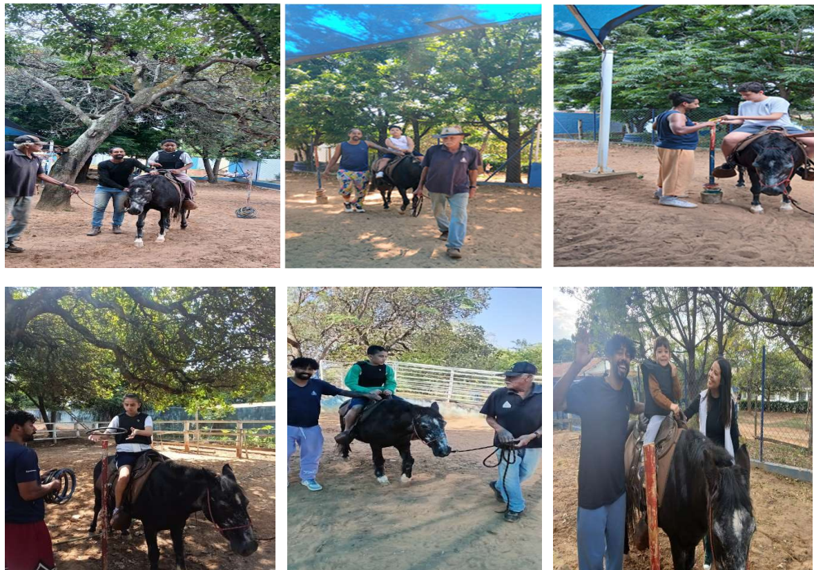
Atendimentos de equoterapia.

Para a realização dos atendimentos, a entidade contou com espaço físico adequado, equipado para a execução das atividades terapêuticas, além de dois cavalos devidamente treinados para a prática da equoterapia, garantindo a segurança, a qualidade e a efetividade das intervenções realizadas.