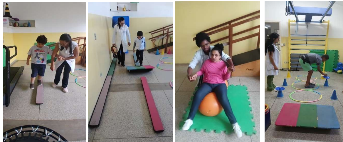
Atendimentos de Fisioterapia individual

Além disso, as intervenções favoreceram o aumento da amplitude de movimento, o alongamento e o relaxamento muscular, a melhora da consciência corporal e o alívio de desconfortos relacionados a encurtamentos musculares.